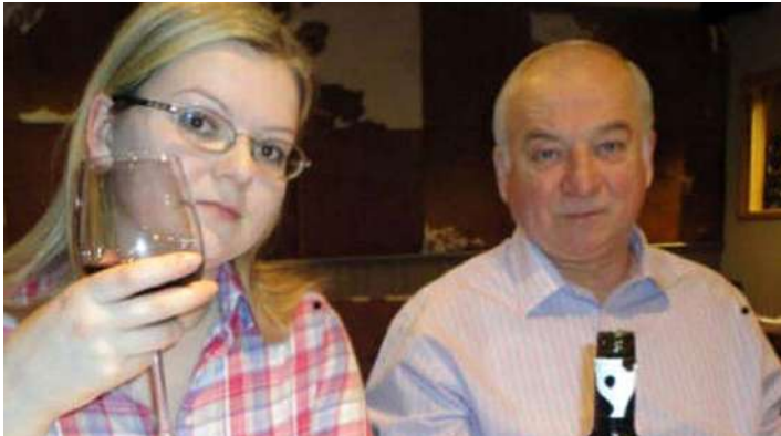
Sergei Skripal and Yulia Skripal

Mart 2018'in başlarında, İngiliz basını devlete ihanet yüzünden Rusya'da hüküm giymiş GRU (Ana İstihbarat Direktörlüğü) eski memuru Sergei Skripal ve kızı Yulia'nın güçlü bir zehir ile zehirlendiğini bildirdi. Her ikisi de durumları kritik olarak hastaneye kaldırıldı. İngiliz soruşturmasına göre kurbanlar, Rusya'da geliştirilen "Noviçok" sinir gazı ile zehirlendi. İngiltere Başbakanı Theresa May zehirlenme olayı ile ilgili Moskova'yı sorumlu tuttu. 2006 yılında, Skripal İngiliz istihbaratına casusluk yapması sebebiyle Rusya'da 13 yıl hapis cezasına çarptırıldı. 2010 yılında Skripal serbest bırakılarak Anna Chapman ve ABD'de gözaltına alınan diğer Rus istihbarat ajanları ile takas edildi. Bunun ardından, Skripal Birleşik Krallık'a teslim edildi.